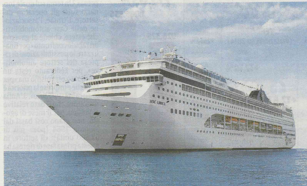
La Msc Lirica, costruita a Saint-Nazaire, sarà allungata e rinnovata da Fincantieri

«Il mercato cinese lo seguiamo attentamente dal 2010, quando abbiamo iniziato a collaborare con Caissa Touristic, un'azienda specializzata nei viaggi outbound dei cinesi. Negli ultimi anni abbiamo notato che i numeri